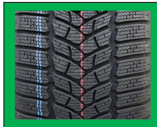
FIRESTONE WINTERHAWK 3 225/45 R17 91H

Alle FIRESTONE WINTERHAWK 3 Testreifen wurden von TÜV SÜD PS auf dem freien Markt gekauft. Alle FIRESTONE WINTERHAWK 4 Testreifen wurden vom Kunden für die Tests zur Verfügung gestellt.